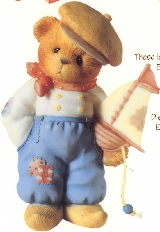
611697 Jan-Dutch Boy